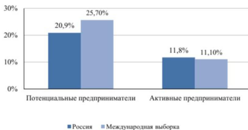
Рисунок 2. Предпринимательская активность студенчества в России и на международном уровне

При этом намерение опрошенных студентов стать предпринимателем в 2023 году по сравнению с 2021 годом слегка снизились: количество желающих открыть своё дело сразу после учёбы сократилось на 2,6%, количество желающих заняться предпринимательской деятельностью через 5 лет после получения диплома снизилось на 0,7%, а количество желающих стать преемниками какого-то бизнеса сразу после учебы и через 5 лет после завершения учебы в вузе снизилось на 0,6% и 0,2 % соответственно.